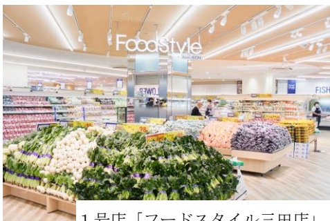
1号店「フードスタイル三田店」