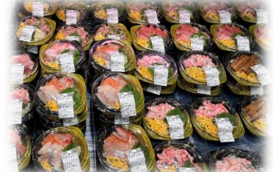
豊洲市場から直接届く新鮮な魚は海鮮丼やお造りにしてご提供