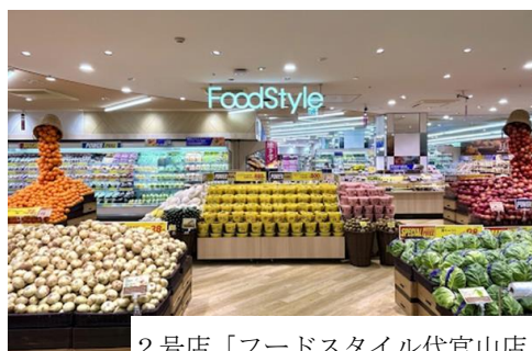
2号店「フードスタイル代官山店」

株式会社イオンフードスタイル（本社：東京都江東区）は、既存店を刷新し、新たなブランド価値を吹き込む「FoodStyle」への転換を加速いたします。